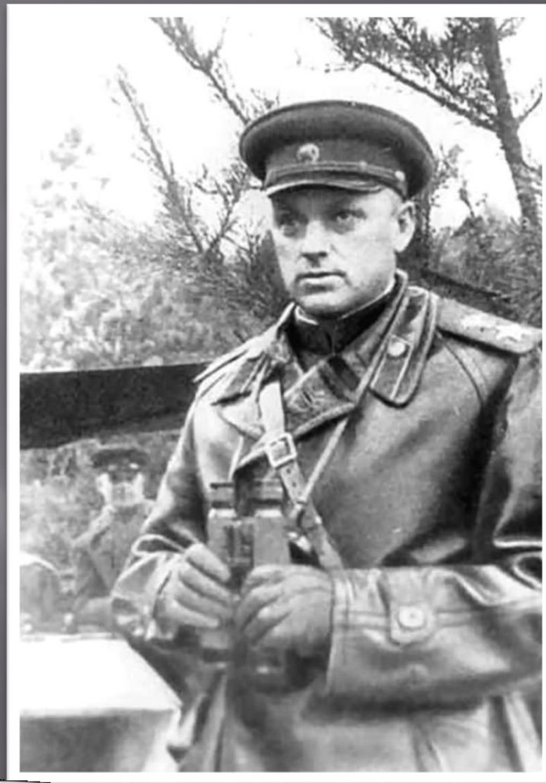
К. К. Рокоссовский